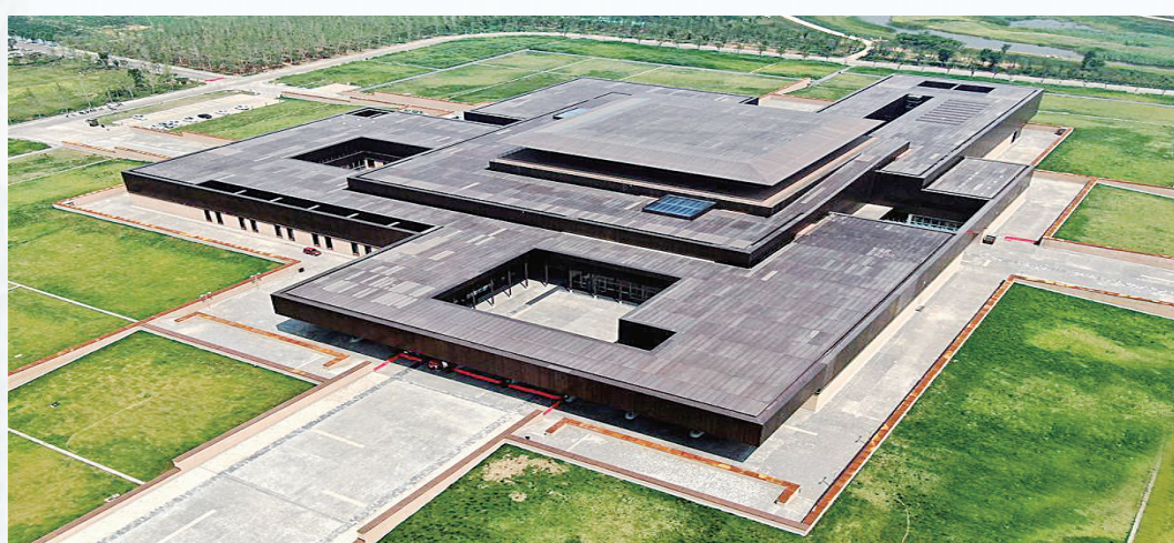
这是7月7日在河南省偃师市拍摄的二里头夏都遗址博物馆(无人机照片)