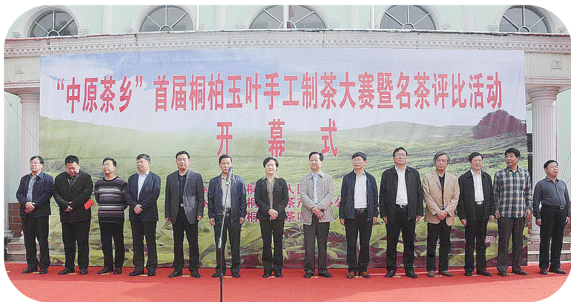
“中原茶乡”首届桐柏玉叶手工制茶大赛暨名茶评比活动开幕式。

一眼望不到边的生态茶园内，翠绿的茶垄随着地势起伏连绵，嫩绿的新芽挤满枝头，茶香馥郁，箫乐悠扬，山歌阵阵，衣着淡雅的采茶姑娘身背茶篓，玉指翻飞，仿佛弹奏一曲美妙音乐……这是记者日前在“中原茶乡”桐柏县安棚镇一年一度的春茶开采仪式上欣赏到的动人场景。