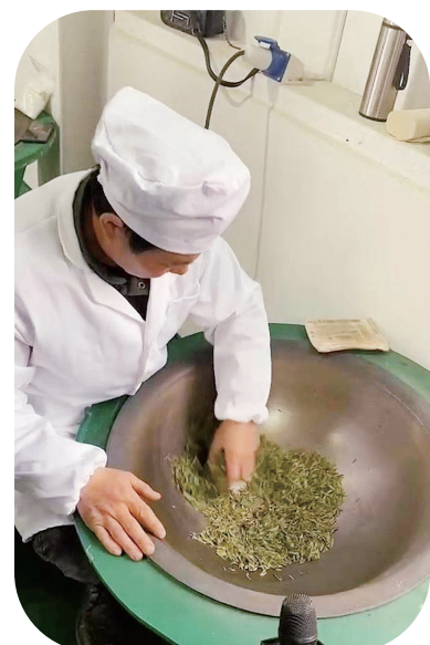
安棚镇制茶车间手工制茶。

加大政府扶持力度，对新建无性系良种茶园种植户予以补贴。建档立卡贫困户当年新建成无性系良种茶园面积在1亩以上（含1亩）、企业、合作社、种植大户集中连片种茶20亩以上（含20亩），每亩成苗4000株以上，经当年年底验收（成活率达85%以上）合格的，一次性给予每亩1000元的良种补贴。对标准化茶园补植改造予以补贴。对重点乡镇、重点村集中连片100亩以上（含100亩）缺苗断垄的老茶园进行补植改造的，县政府集中采购无性系良种茶苗下发乡镇，由乡镇每亩按成苗4000株统