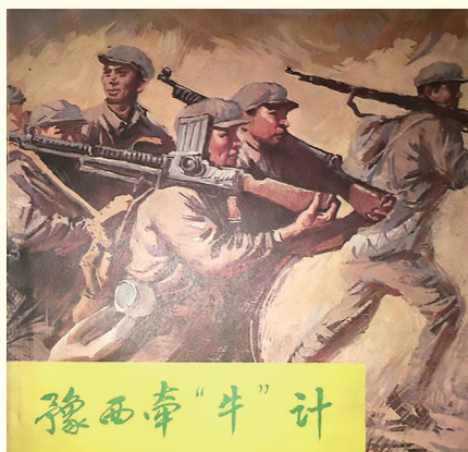
豫西牵牛战宣传画。