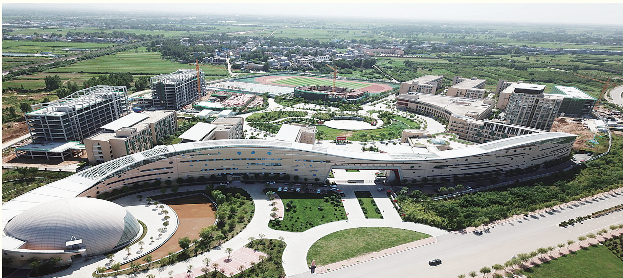
南阳工艺美术职业学院