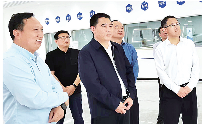
卧龙区委副书记、区长杜勇（中）到卧龙艾草产业园调研指导工作。