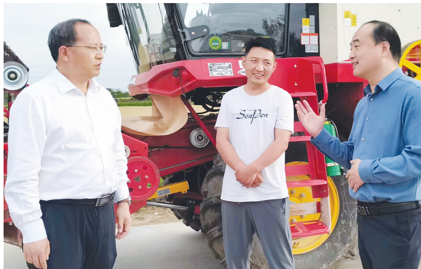
卧龙区委书记吕志刚（左一）到蒲山镇安排部署“三夏”生产工作。

近年来，蒲山镇党委、镇政府积极响应国家乡村振兴战略和市委、区委高质量发展的号召，以“五星”支部创建为抓手，紧紧把握南阳建设现代化省域副中心城市的时代契机，提出了“一二三四五六七”（树牢“一个理念”，聚焦“两大行动”，打造“三个高地”，守好“四条底线”，建设“五个蒲山”“六大区域”“七个聚力”）的发展布局，整合优势资源，走出了一条生态、绿色、和谐的奋进之路，着力打造蓬勃发展的生态、绿色、和谐的奋进之路，着力打造蓬勃发展的生态、绿色、和谐的奋进之路，着力打造蓬勃发展的生态、绿色、和谐的奋进之路。