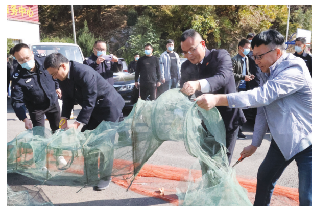
11月10日,西峡县人民检察院干警与渔政执法人员联合进行现场巡查取证,收回河道中的非法捕鱼围网。②9

自己的责任。作为丈夫和妻子,你们需要共同努力,为孩子们树立一个好榜样。如果你们能够珍惜彼此的感情,共同努力为孩子们建立一个完美的家庭,那么你们将会成为孩子们生命中最重要的人。最后,我希望你们能够冷静思考,慎重考虑离婚的决定。请相信,只要你们愿意努力,愿意付出,一定可以渡过这个难关,让家庭重新回到和谐、幸福的状态。”②9