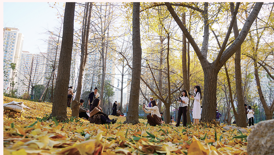
市民深度接触自然