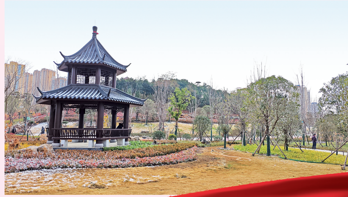
雪中亭台如诗如画