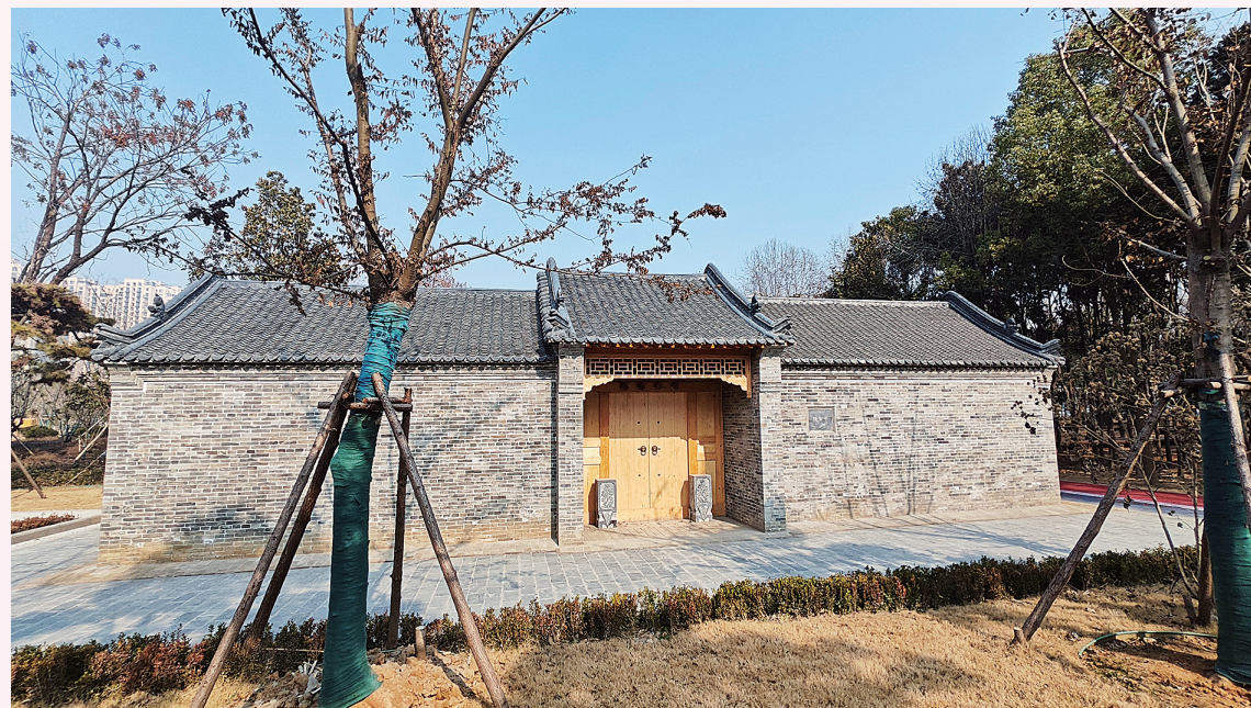
林中接官亭露出一角