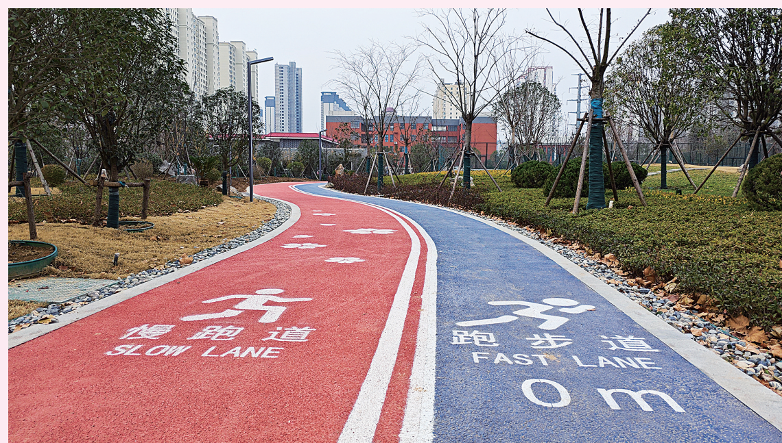
1100米塑胶跑道亮相公园

1月22日，天气晴好，申伯公园热闹非凡。欢声笑语中市民结伴而入，眼前挺立的申伯雕像凸显着公园的主题，温馨的游乐场中充满童言嬉笑，脚下舒适的步道蜿蜒于林间花旁……备受市民期待的申伯公园正以崭新的面貌走进市民生活，自然的美丽与和谐在冬日如阵阵清风在南