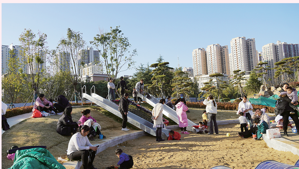
游乐场充满欢声笑语