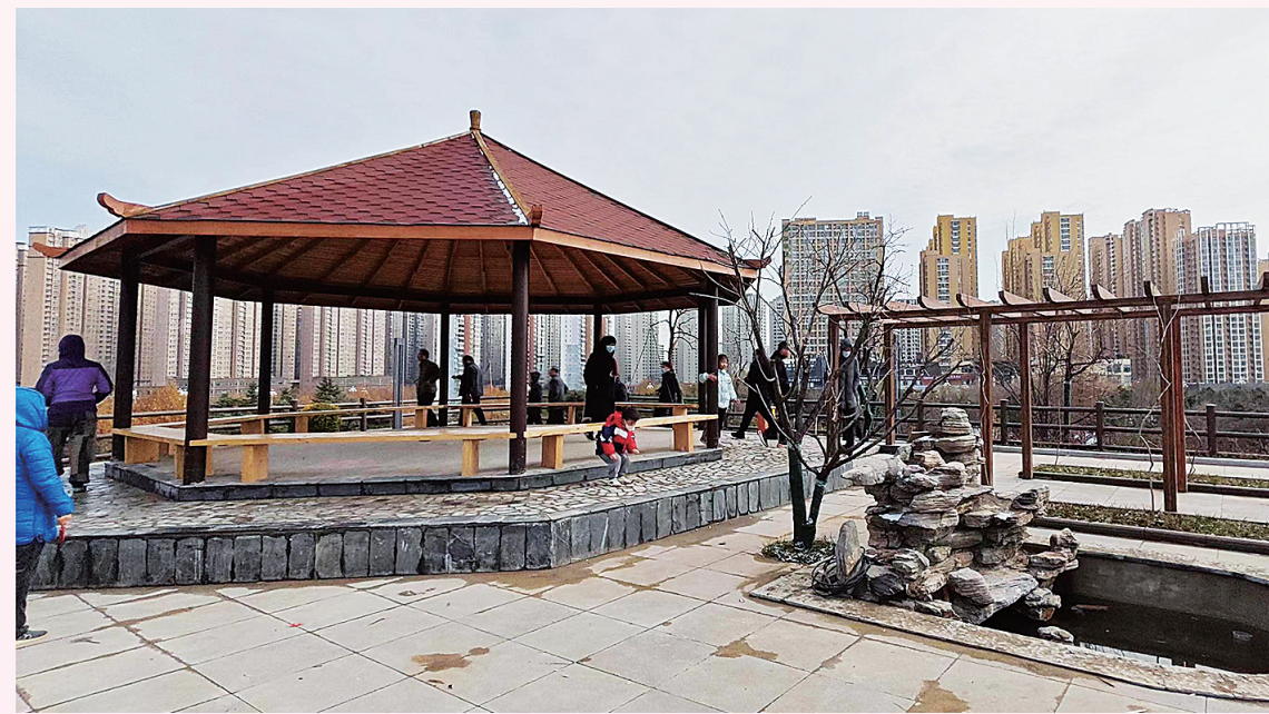
游人在公园最高处八角亭畅玩