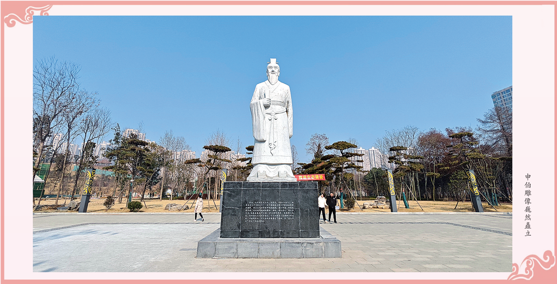
申伯雕像巍然矗立

1月22日，天气晴好，申伯公园热闹非凡。欢声笑语中市民结伴而入，眼前挺立的申伯雕像凸显着公园的主题，温馨的游乐场中充满童言嬉笑，脚下舒适的步道蜿蜒于林间花旁……备受市民期待的申伯公园正以崭新的面貌走进市民生活，自然的美丽与和谐在冬日如阵阵清风在南