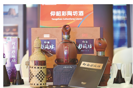
活动现场展示核心产品。