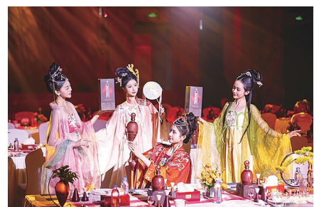
模特展示彩陶坊太阳、天时产品。