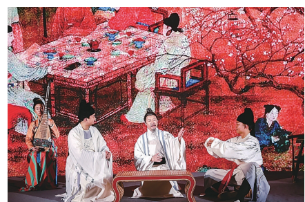
仰韶彩陶坊·太阳盛宴现场文化展演。