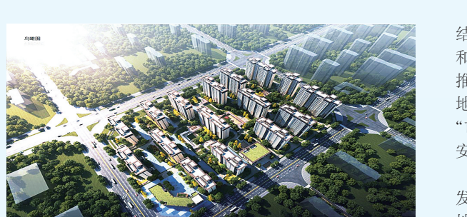
宏景·丰实苑项目整体效果图。

2023年,宏景置业在南阳投资集团的领导下始终紧跟城市发展步伐,筑牢“国企”根和魂,在聚焦主责主业、稳定企业经营主体的同时,也在扛稳保交楼责任、提振南阳楼市信心等方面肩负起重要责任,为南阳城市发展贡献力量。企业发展的飞跃。公司各项经营指标完成良好,项目回款成效显著,先后被评为2023年度壹街区街道经济发展突出贡献企业和一季度经济发展先进企业。