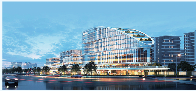
健康之都城市商业综合体项目效果图。

2023年,南阳市宏展房地产开发有限公司坚定“国企姓党”的政治本色,积极履行国有企业政治责任、社会责任、经济责任,始终坚持“四敢”精神、践行“四个极限”,坚决打好主动仗、下好先手棋,统筹抓好各项工作,圆满实现了民生工程和重点项目的开发建设目标。