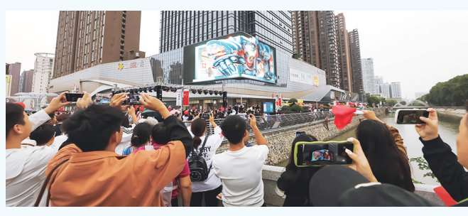
“南阳之眼”裸眼3D大屏。

告基础设施投资建设,积极布局谋划精品网红项目。2024年,南阳城投数字传媒始终秉持南阳投资集团“担当、奉献、奋斗、高效、廉洁”的企业精神,以“城市形象的点睛者、城市文化的传播者、传媒行业的领军者”的企业定位,通过“优存量、拓增量”发展战略,快速实现自身做大做强做实,真正引领户外广告行业健康发展,更好地服务城市、服务人民。