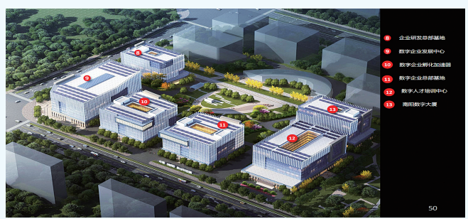
中原(南阳)数谷科技园效果图。

2023年,桐柏盘古公司以绿色经济、可持续发展为出发点和着力点,践行国企初心使命,坚持独立自主的市场化运营道路,以“资本+”的发展理念,“投资+运营”双轮驱动,“产业+金融”协同发展,坚持做强资本、做大产业、做优生态三大目标。南阳投资集团与桐柏县人民政府在全方位战略合作,实施全域旅游开发,采用“AIRO+投资位+EPC”的模式,由县政府授权盘古公司对桐柏全域旅游进行“投、融、建、管、运”全产业链开发。