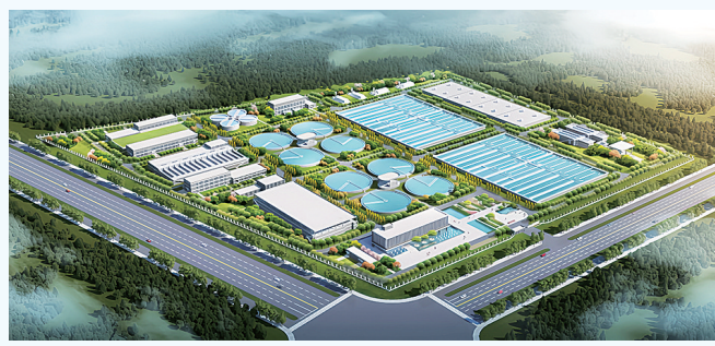
白河南污水处理厂二期效果图。

2023年,南阳城投控股有限公司始终围绕中心、服务大局,认真贯彻落实市委、市政府及南阳投资集团党委有关工作要求,牢牢把握高质量发展主线,坚持党建引领发展总方向、稳中求进工作总基调,聚焦城市运营服务和实业、产业投资发展,攻坚克难,善作善成,推进各项业务协同发展,全面开花。