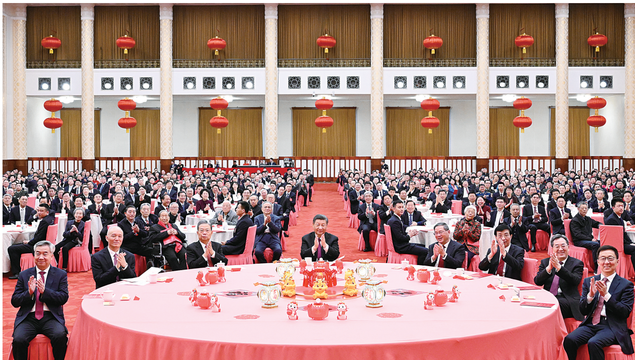
2月8日,中共中央、国务院在北京人民大会堂举行2024年春节团拜会。中共中央总书记、国家主席、中央军委主席习近平发表讲话。