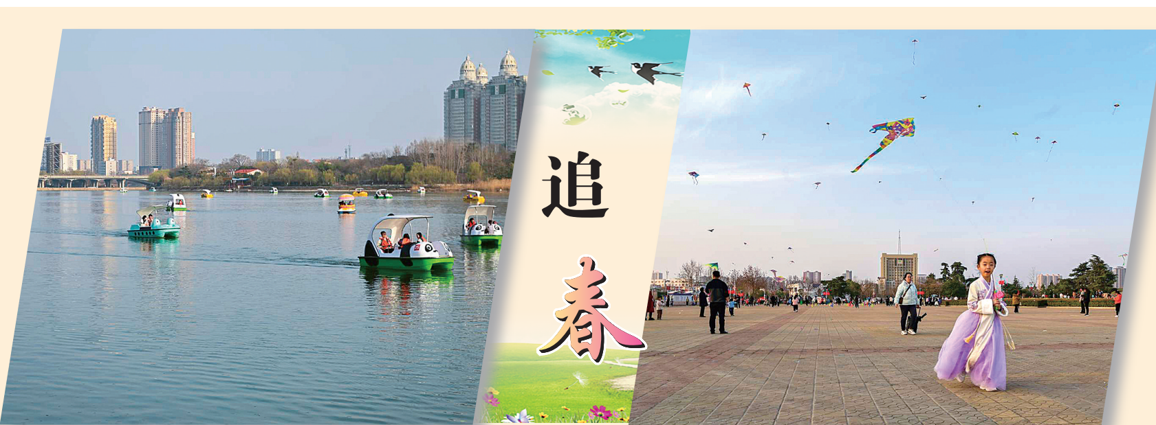
3月10日，市民春日下泛舟白河。

项目 本项目雨污分流改造需要对非机动车道进行封闭施工，快车道和人行道不封闭，可通行。为方便市民出行以及交通组织，该项目计划自2024年3月10日起开始采取分段、分时间、分区域进行围挡安装。 本项目雨污分流改造需要对非机动车道进行封闭施工，快车道和人行道不封闭，可通行。计划2024年3月10日起对部分非机动车道开始围挡。 南阳市住房和城乡建设局 2024年3月7日