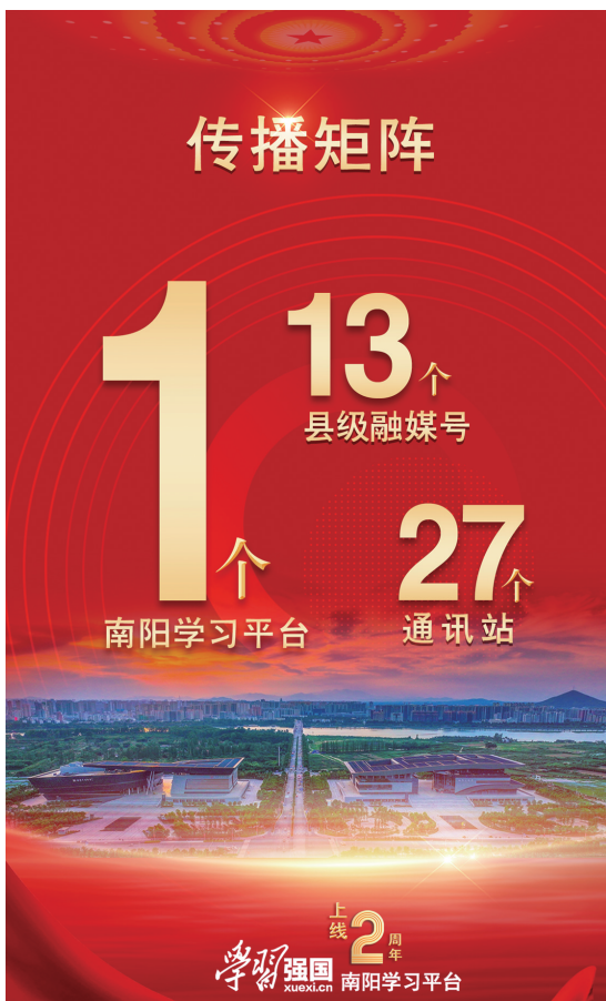
“学习强国”南阳学习平台上线两周年海报。黄翠制图

资源的能力和水平，在市县联动、协同作战中，有效提升了县级融媒传播效能，有力拓展了宣传的广度和深度。