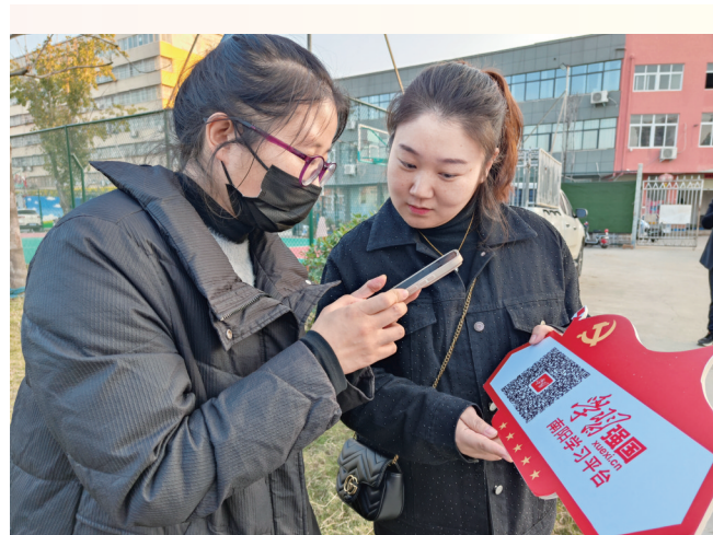
“学习强国”南阳学习平台进社区。②13

2023年，“学习强国”西峡融媒号累计供稿933篇，签发873篇，被国家总平台采用23篇；2024年1月至2月，西峡累计被市以上平台选用各类稿件155篇，其中被总平台选用4篇，发稿数量和总平台选用量均走在全市前列。②13