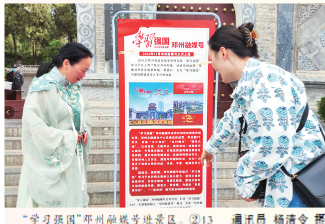
“学习强国”邓州融媒号进景区。②13