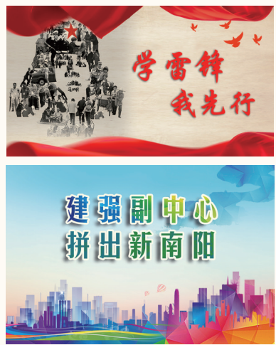
南阳学习平台部分专题。

两年来，“学习强国”南阳学习平台干货满满，实力圈粉，以权威的内容、丰富的内涵、鲜明的特色、强大的功能全力打造学习新高地，日渐成为展示南阳形象的重要窗口。2024年1月1日至3月8日，“学习强国”南阳学习平台签发稿件1562条，47条稿件被总平台选用，其