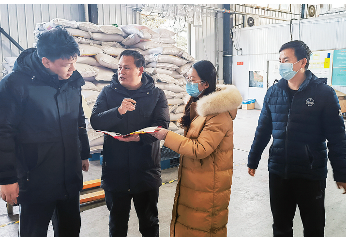
经开区服务小分队为企业送服务、送政策。