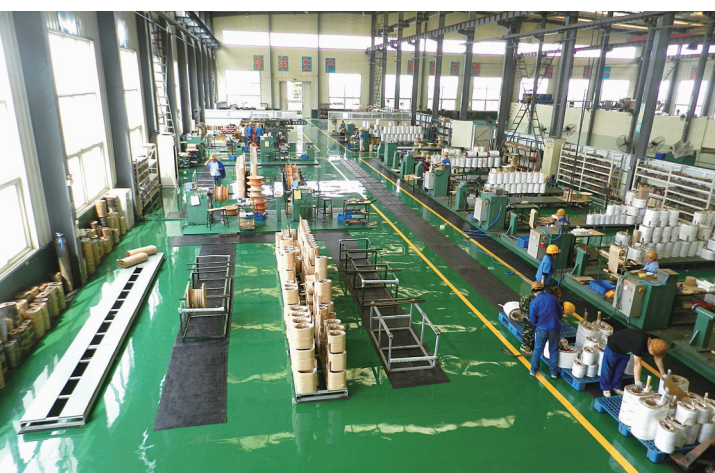
河南天力电气设备有限公司生产车间一派繁忙景象。