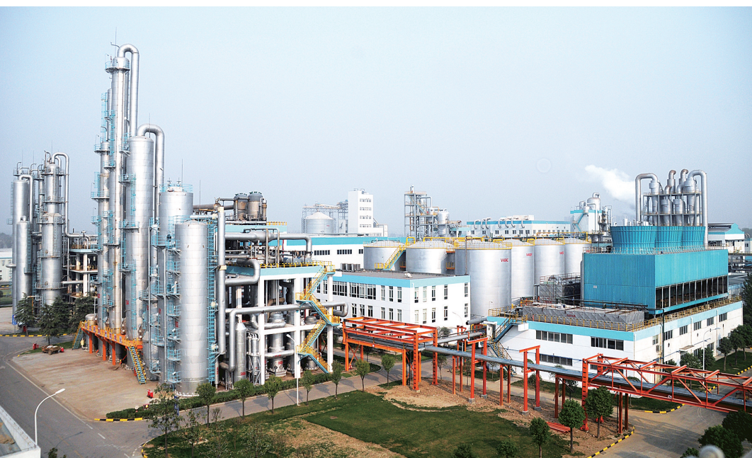
中鑫新能源燃料乙醇生产厂区一角。