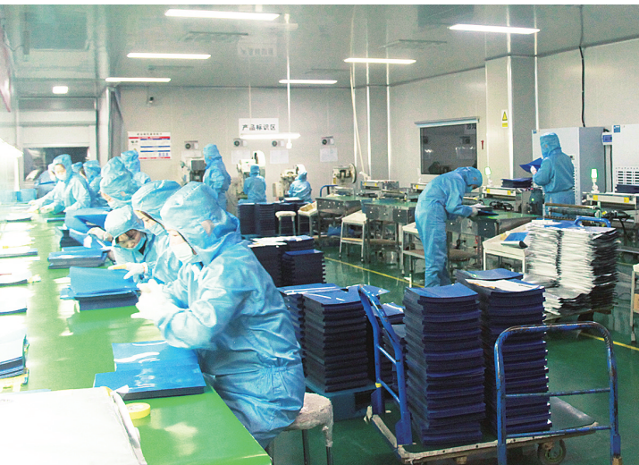
南阳柯丽尔科技有限公司春节期间满负荷生产，保障市场供应。