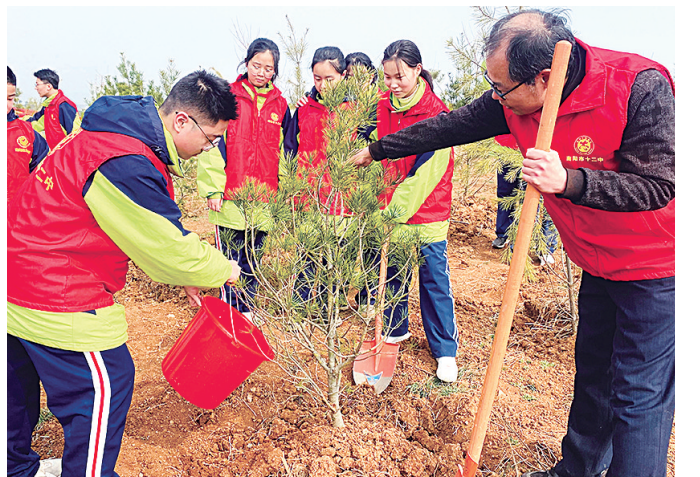
三月春光至，添绿正当时。日前，市十二中的师生志愿者在卧龙区潦河镇开展了“手植绿意 春满心田”义务植树活动。

念，参赛教师课堂目标明确、设计巧妙、充满趣味，循序渐进地解决重难点，环节紧凑，过渡自然。参与听课的教师专心致志，对精彩课堂进行记录，从中汲取成长的营养。此次大比武活动为教师们提供了一个相互学习、共同进步的平台，促进了教育资源的共享和优化配置，对提升教育质量、推动教育创新等产生了积极影响。