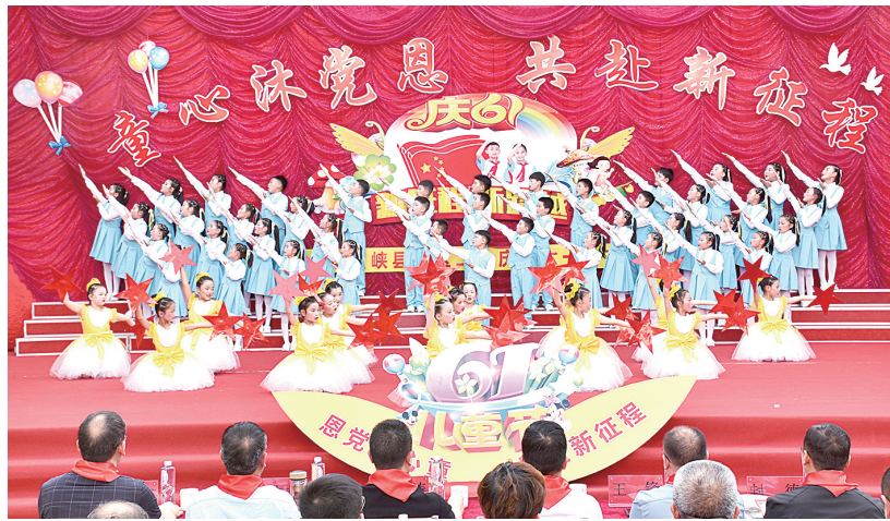
“童心沐党恩 共赴新征程”六一文艺汇演(资料照片)。

连续17年开展“校园读书节”活动，先后被评为全国青少年读书育人特色学校、河南省语言文字规范化示范学校、河南省书香校园。在教育教学方面，学校狠抓作业管理，在提质增效方面下功夫。