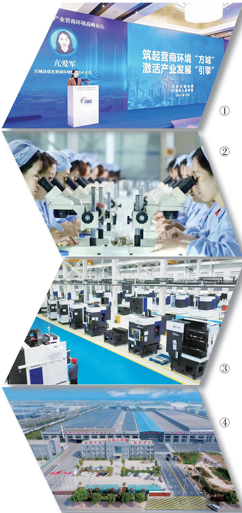
图① 方城县作为全国唯一县级代表参加“2023首届中国产业营商环境高峰论坛”。 图② 全国制造业单项冠军示范企业——中南钻石有限公司生产车间。 图③ 南阳煜众精密机械有限公司智能化生产线。 图④ 方城县先进制造业开发区一隅。

百舸争流奋楫者先,中流击水勇进者胜。营商环境没有最好,只有更好,优化营商环境,还需下大力气、啃硬骨头。方城县正以全新的状态奔跑在优化营商环境的漫漫征程中,持续瞄准企业投资生产经营中的“堵点”“痛点”,出台更多实实在在的举措,让企业得到更多实实在在的实惠。②6