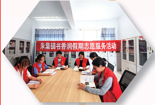
志愿者协会开展“书香假期”服务活动。