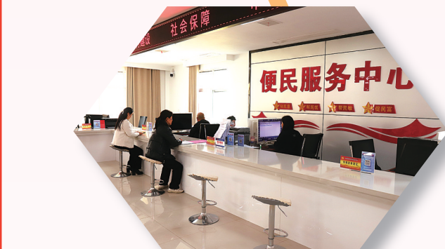
群众在便民服务中心办理业务。