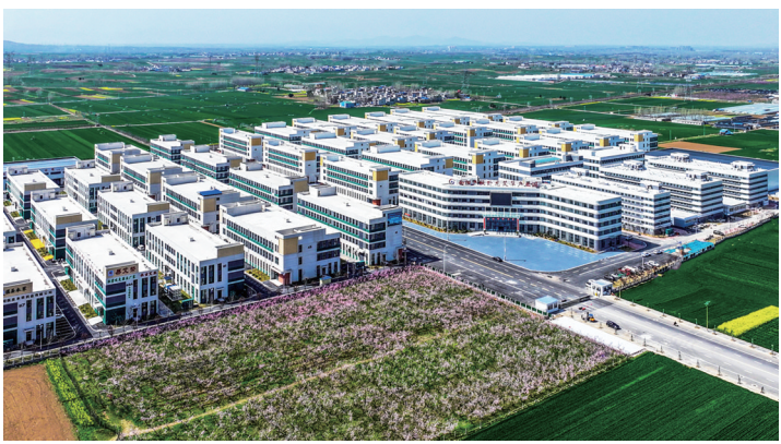
卧龙区蒲山镇艾草产业园。