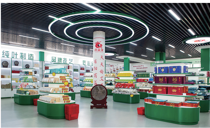
药益宝艾草产品展示区。