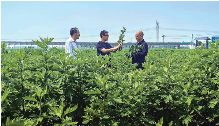
社旗县大冯营镇艾草种植基地。