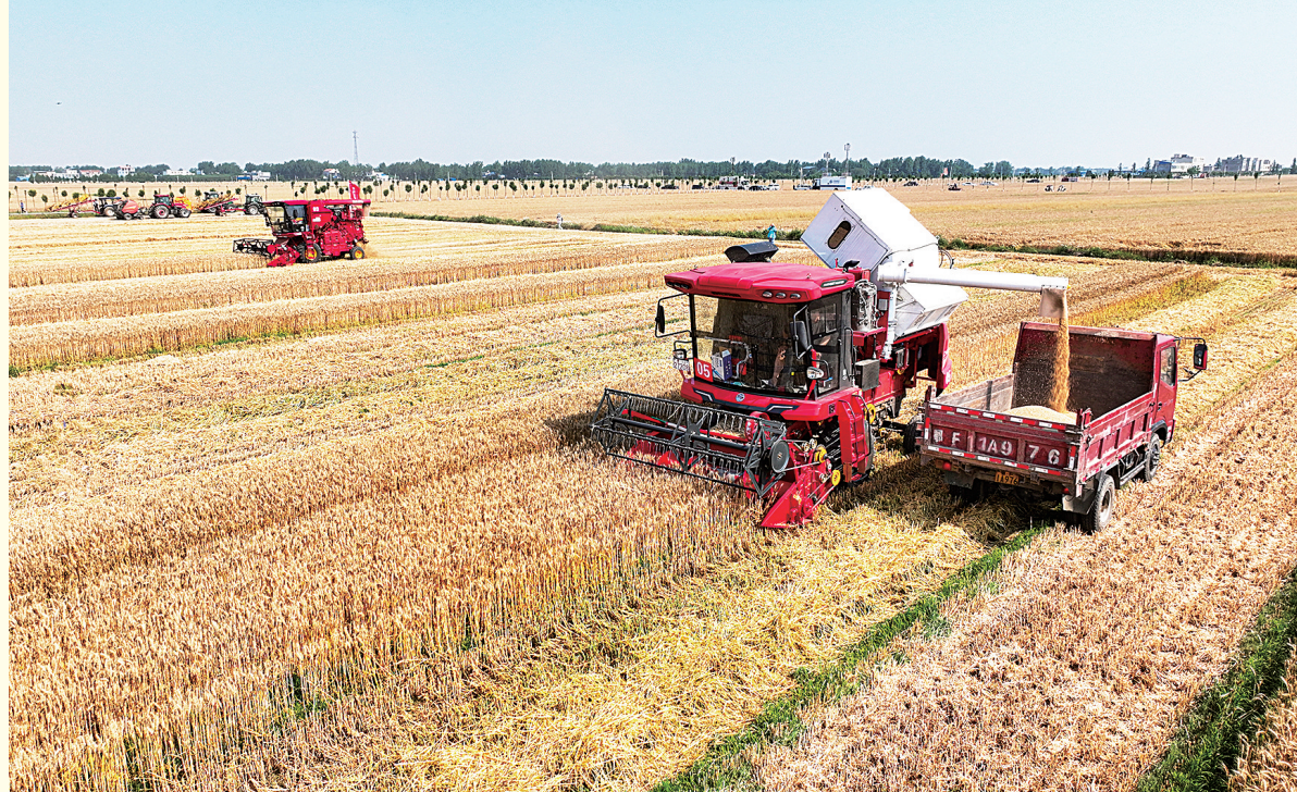
5月30日,新野县新甸铺镇小麦喜获丰收。金黄的麦田里,联合收割机往返穿梭,一派丰收的景象。②8

良种覆盖率达到100%,全市高标准农田建设区域内农业产业化龙头企业126个、农民合作组织4116个、家庭农场2406个,土地流转托管70%以上