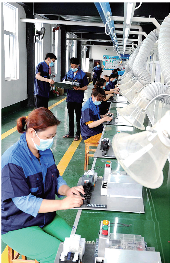
河南佳格电器有限公司生产车间里,工人正加紧生产订单产品。

2024年上半年,该镇实现一般公共预算收入623万元,其中高新技术企业、科技型中小企业累计上缴税金107.57万元,同比增长29.87%,有效拉动全镇一般公共预算收入稳步增长。②8