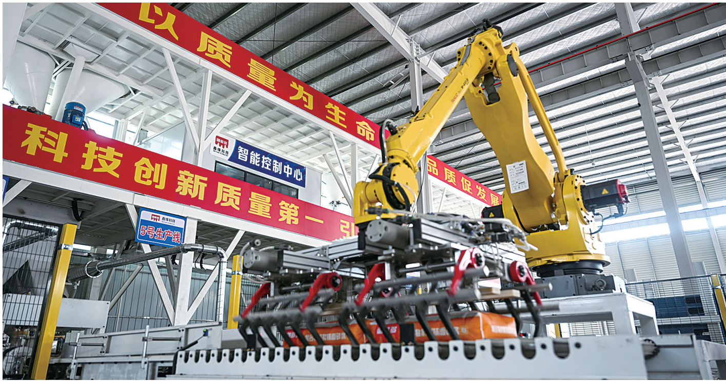
新鑫缘建材科技有限公司建成全自动智能化生产线,生产效率大幅提高。