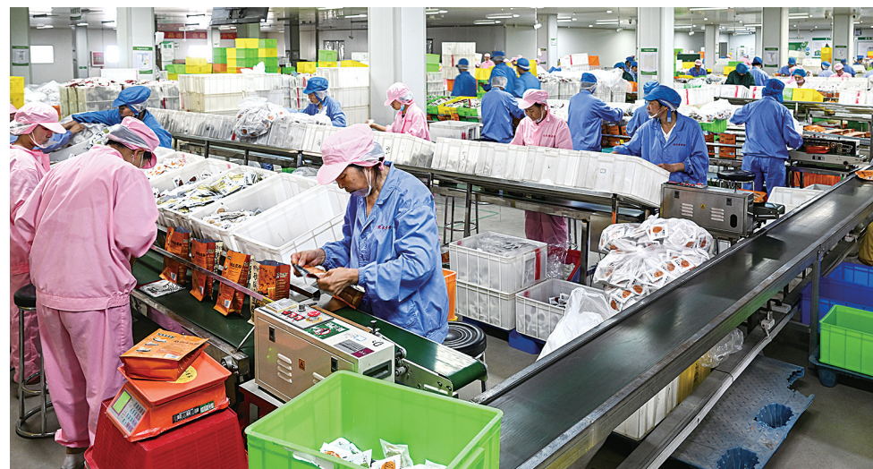
南阳宛禾香食品有限公司,新增生产线16条,实现年产值1.3亿元,税利400万元。图为繁忙的生产包装现场。