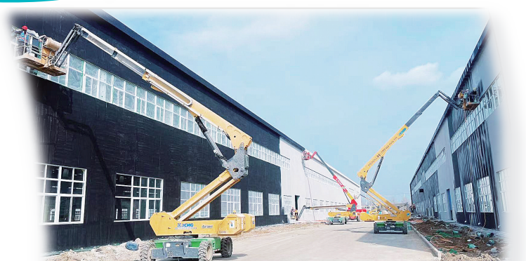
电驱产业园2#、3#厂房加紧施工。