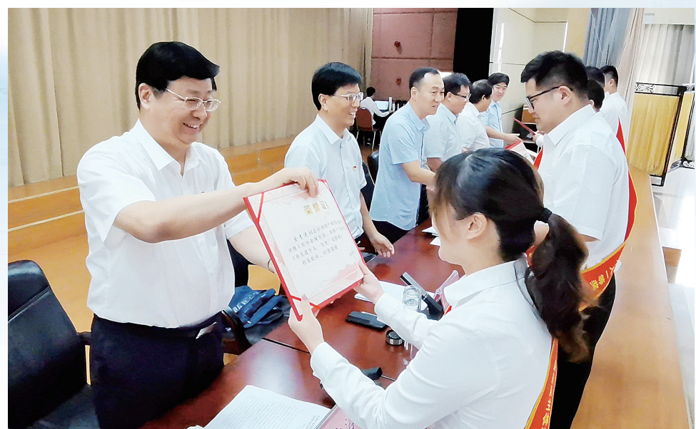
产投集团AAA主体信用评级表彰仪式。