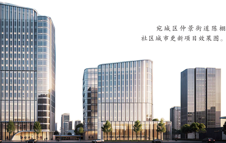
宛城区仲景街道陈棚社区城市更新项目效果图。