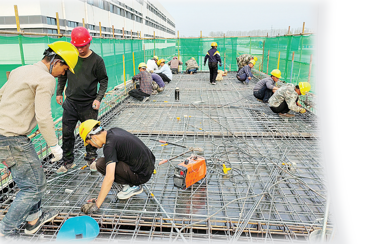
国际家纺产业园建设现场。