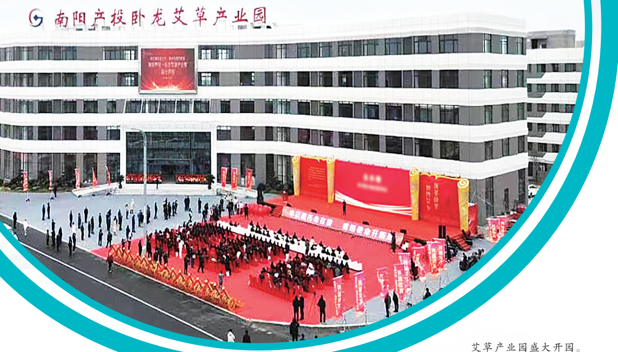
艾草产业园盛大开园。