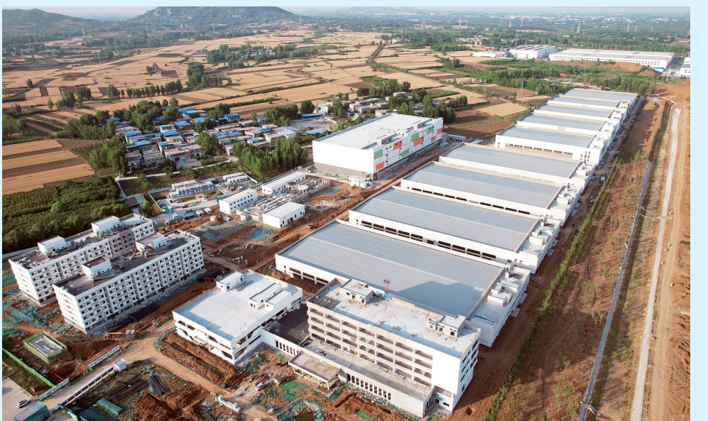
食品产业园厂房建筑主体封顶。