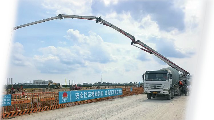
产投凯华光高阻隔膜产业化项目施工现场。