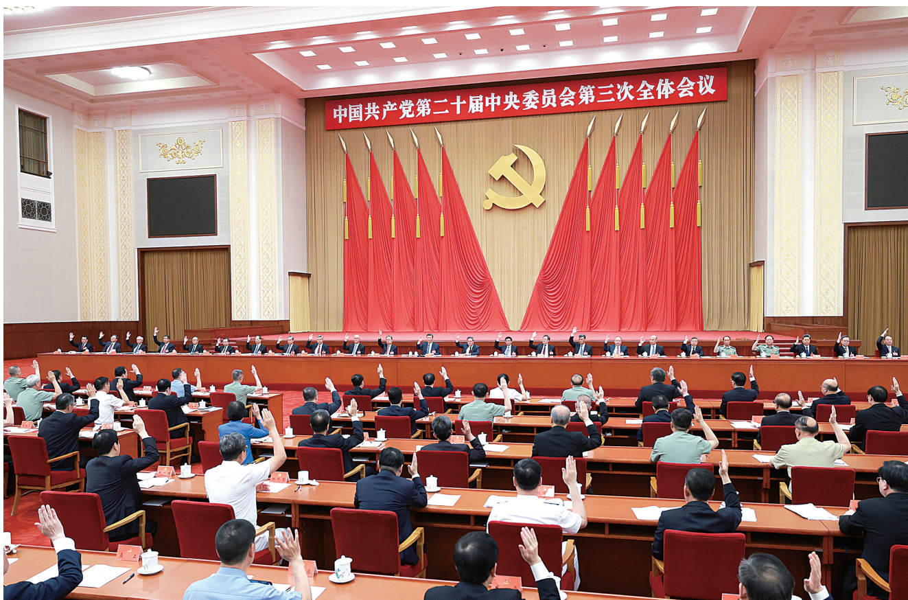
中国共产党第二十届中央委员会第三次全体会议,于2024年7月15日至18日在北京举行。中央委员会总书记习近平作重要讲话。②4