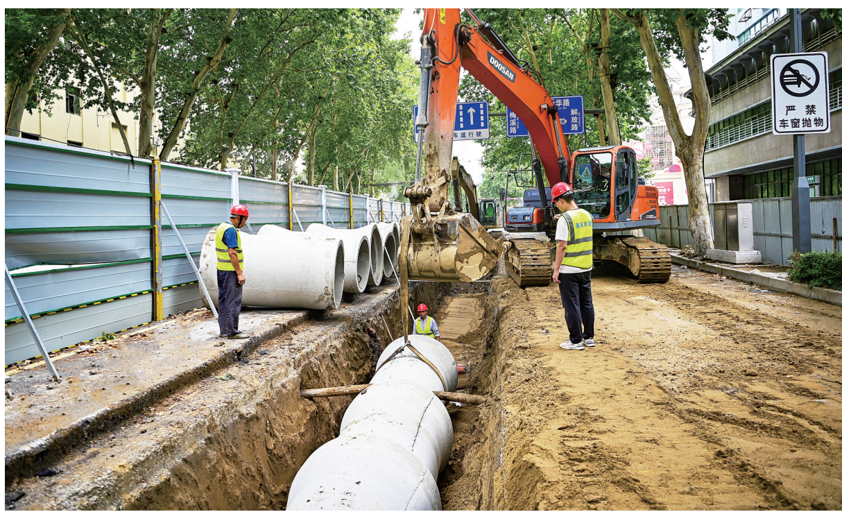
图为7月29日，人民路排涝工程现场，工人们正热火朝天忙碌。

今年以来，我市贯彻落实中心城区2024年城市建设提质“八大行动”实施方案，计划对中心城区29个路段的排水管网升级改造，为了抢工期，市市政工程总公司出动施工人员700多人，各类机械260台，分两班轮流施工，快速推进。为早日还路于民、造福于民，市市政工程总公司不断优化施工方案，加大人员、机械投入，加班加点，轮班作业，采取分段分半幅等