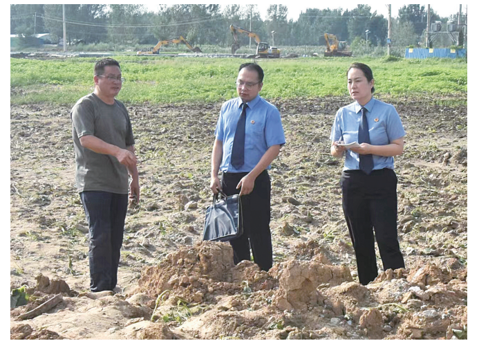
社旗县人民检察院干警日前在该县陌城镇，对受到污染的耕地进行实地勘察，调查取证，收集线索。②4

模型”，鼓励办案检察官通过理论建模、数据运算和智能分析，为检察官在“诉前”提出精准量刑建议参考。成立数字检察办公室，发挥技术骨干作用，不断学习先进地区的先进经验，推广成熟可使用的大数据模型，将各地已经成型推广的大数据法律监督模型进行分类，匹配适用的办案部门，通过制作操作指引手册、U盘拷贝发放观看、月度使用次数及成案线索通报、日常解决操作难题等方式，重点抓好模型应用的深度与广度。加强业务数据研判和类案分析，主动联合公安系统、相关行政职能部门召开圆桌会议，建立完善大数据共享机制，打破数据壁垒，畅通数据传输及共享渠道。②4