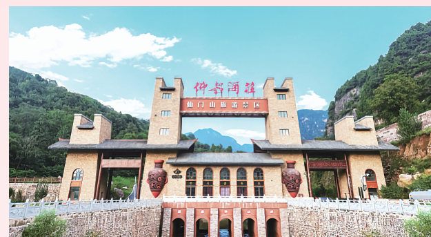
文化味十足的河南仙门山景区大门。

可以想见,十万陶粉欢乐季讲好仰韶故事、强化文化IP,在品牌表达不断进阶的营销、文化营销的双轮驱动下,更好地为仰韶酒业品牌打造提供源源不断的能量。②8 (申明贵)