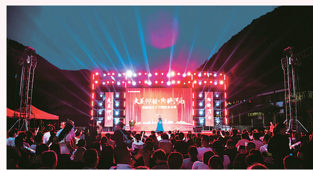
晚上河南仙门山演出现场。