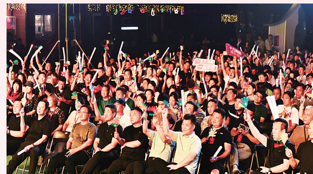
现场陶粉们欢乐开怀。