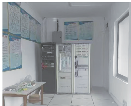
中盛南都领城消防控制室无人值班