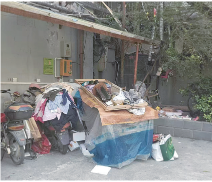
诚发书香苑杂物堆积