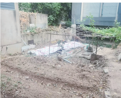
罗马帝景绿化带内种菜