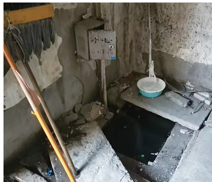
中州大厦消防设施损坏严重