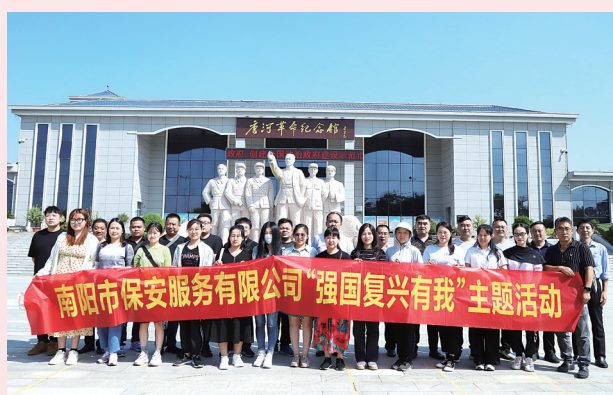
开展主题教育活动。