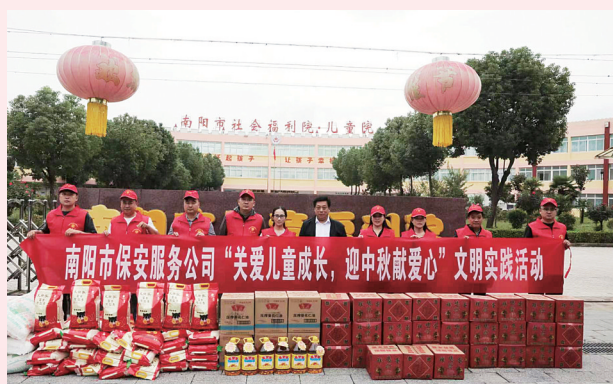
开展文明实践活动。