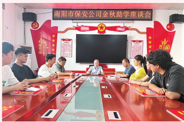
参与捐资助学公益活动。