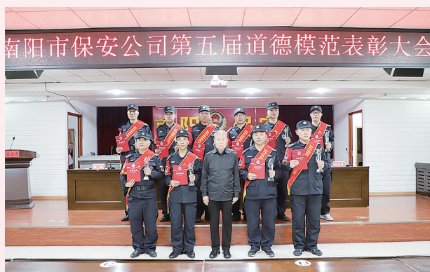
评选道德模范树立先进典型。