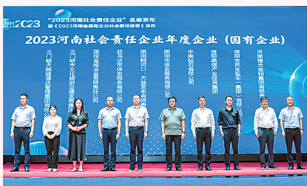
南阳市保安公司获评“2023河南社会责任企业年度企业(国有企业)”。