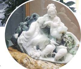
▲玉雕作品《盈盈一水间》

内，成就了两名国家级工艺美术大师和7名国家级玉雕大师、44名省级玉雕大师、106名高级工艺师，被誉为“豫西南的职教明珠和大师的摇篮”。从这些作品中，看到了南阳玉雕文化的未来，感受到南阳工艺美术职业学院未来可期，相信一代代南阳玉雕大师将从南阳工艺美术职业学院走出来，走向全国，走向世界，传播玉文化，谱写更加绚丽的篇章。