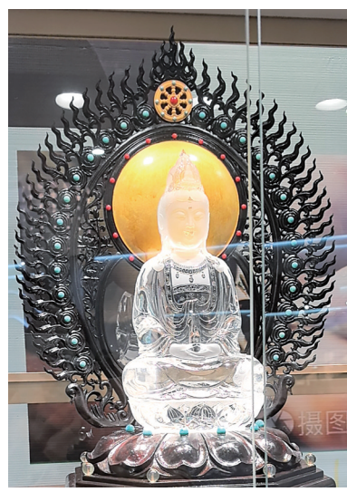
▲玉雕作品《净水观音》