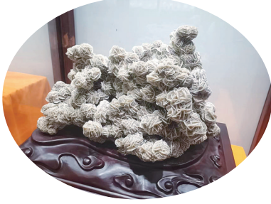
▲造型别致的原石矿晶