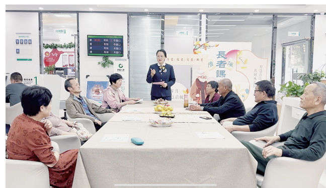
近日，中国人寿新野支公司工作人员邀请老年客户到公司，积极向老人们讲解金融防诈知识，并帮助他们下载防诈骗APP，让他们远离各种金融陷阱。②8

技型中小微企业，着力推介科技e贷、专精特新“小巨人贷”、纳税e贷、资产e贷、链捷贷等重点产品；对个体工商户、家庭农场、农民专业合作社、种植养殖大户等经营主体，着力推介商户e贷、惠农e贷、“智慧畜牧贷”、个人生产经营贷款等重点产品。该行桐柏县支行组织网点开展“千企万户大走访”外拓活动，一天时间营销惠农e贷8户金额120万元、商户e贷意向客户6户金额300余万元。②8