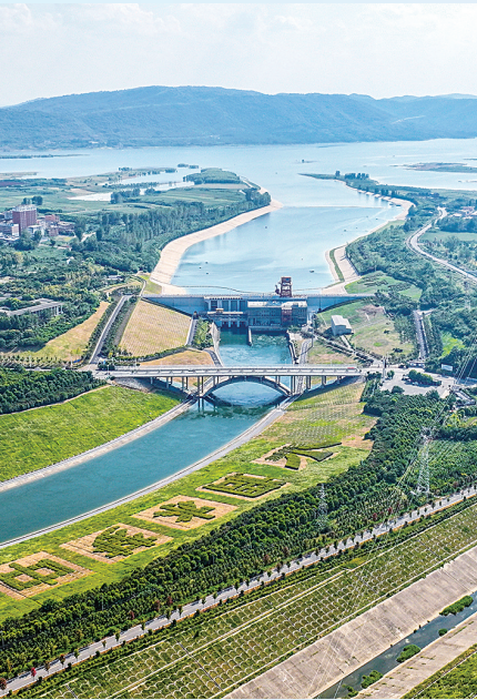
筑牢生态屏障,扛牢水质安全政治责任。

回望即将过去的2024年,面对严峻复杂的外部环境,我市锚定“建强副中心、打造增长极、奔向新辉煌”发展总目标,围绕“五聚五提”工作总抓手、“六个弘扬”作风总要求和“四个自觉”干事总保障,牢牢把握高质量发展首要任务、人民至上的根本立场,以大局统一思想,以事业凝聚共识,以实干勇毅前行,统筹推进稳增长、扩内需、强创新、调结构、惠民生、抓改革、优环境、防风险、抓党建各项工作,交出了一份厚实的成绩单——全市经济社会发展呈现稳进提质、持续向好的良好态势,民生福祉不断增进,社会大局保持稳定,党的建设持续加强,主要经济指标增速有望继续高于全省平均水平,保持全省第一方阵……各项工作取得积极进展,在南阳省域副中心城市建设持续突破的关键节点上谱写了积厚成势的绚丽篇章。