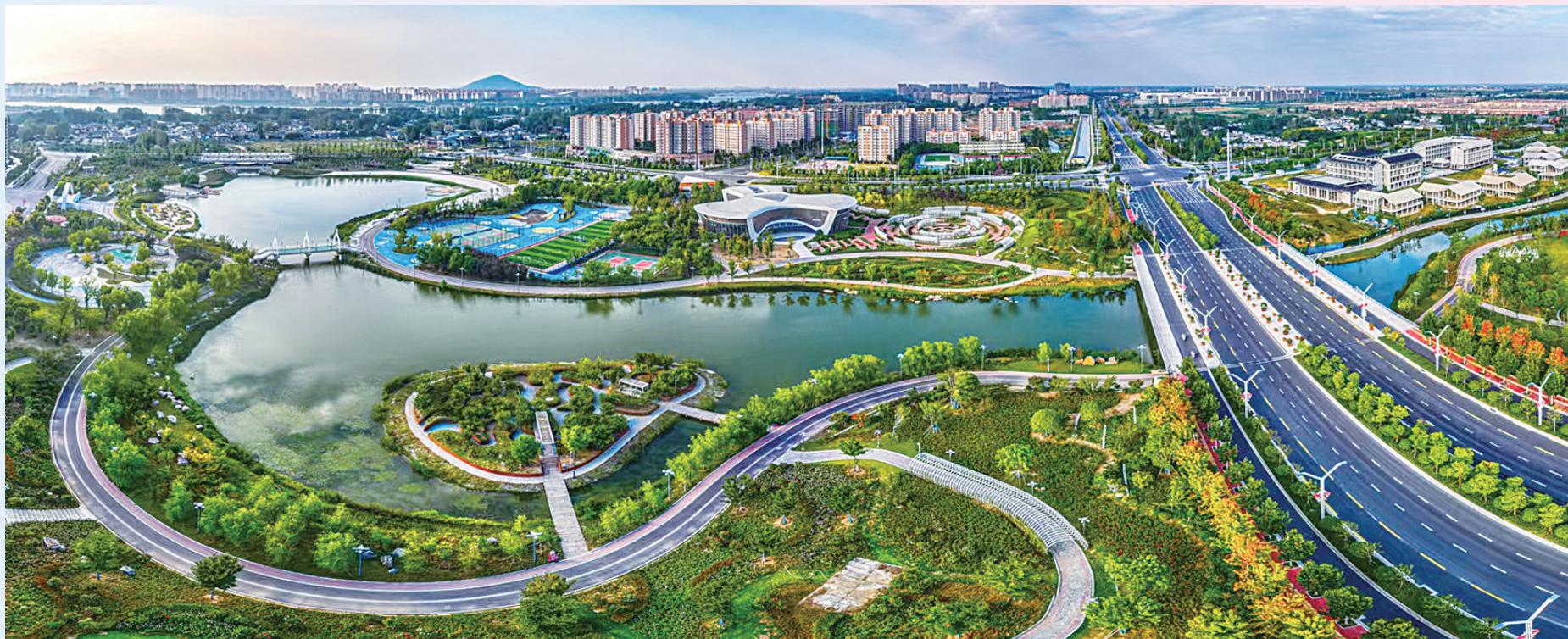
推动中心城区快“起高峰”。