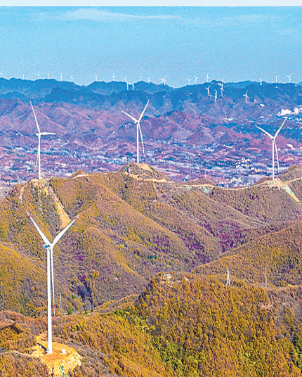
构建“风光水火储”大能源保障体系。

风帆劲鼓势正扬,乘势而上再突破。展望2025年,全市经济工作“路线图”催人奋进。全市上下要守正创新、拼搏实干,在大局下行动,在关键处发力,推动“五聚五提”突破见效,绘就中国式现代化建设南阳实践的绚丽篇章。