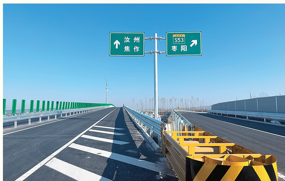
方城境内,方唐高速北接汝州、南向阳阳