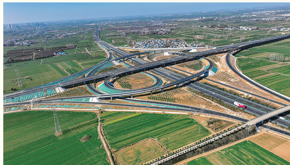
方唐高速与沪陕高速交通枢纽处