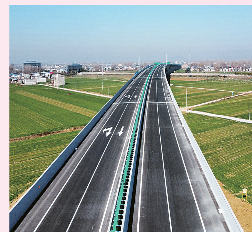
方唐高速南北调干渠附近段