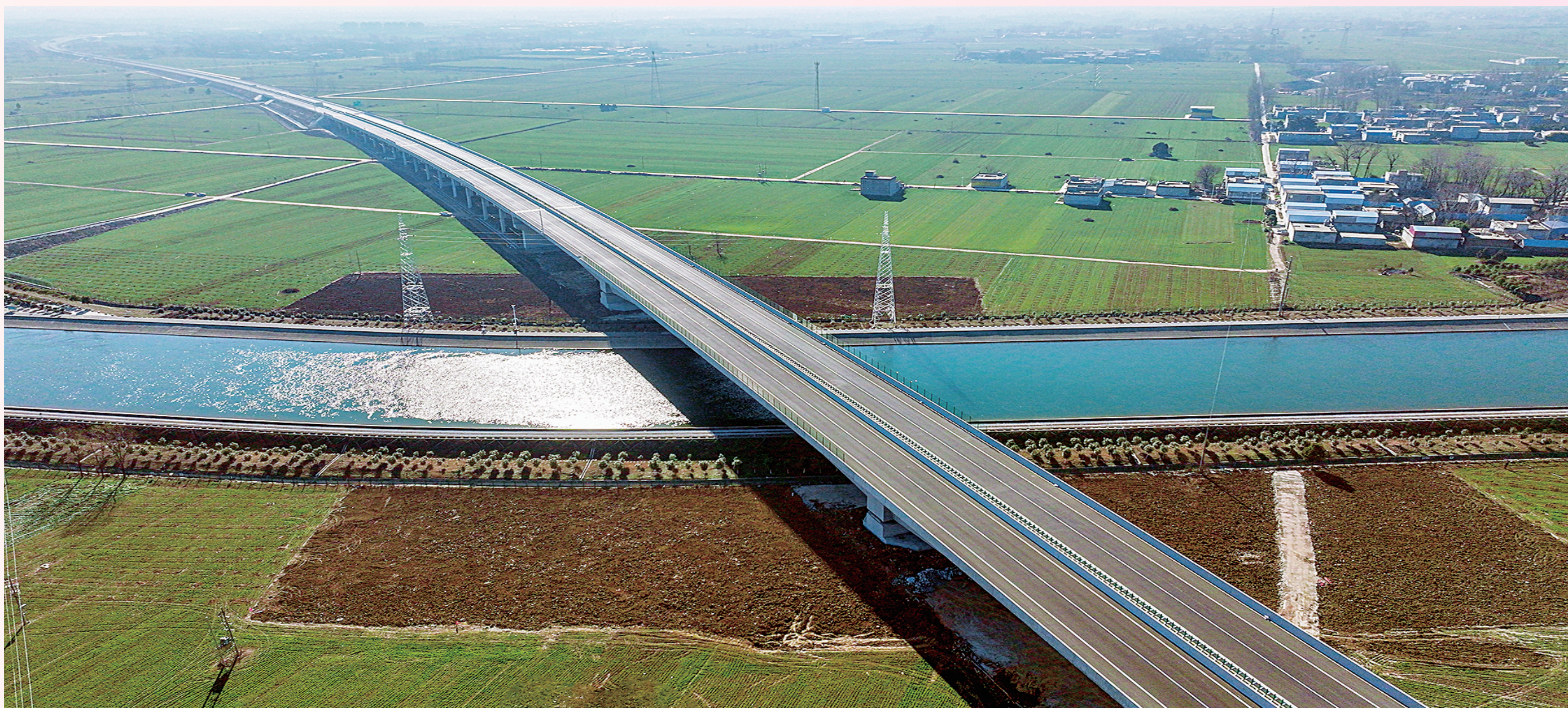
方唐高速跨南北调干渠段

3年又7个月间,方唐高速项目突破了众多建设难题,全体参建人员勠力同心、攻坚克难,在南阳这片热土上谱写一曲新时代人的奋进之歌。