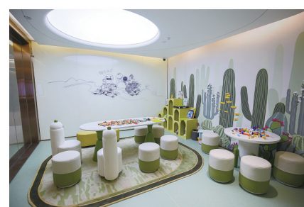
康养中心儿童智力开发室。