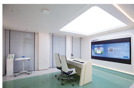
康养中心远程医疗中心。