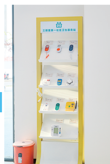
急救保命+生活服务终端产品展示。

在这个全民都注重健康的时代,居住升级已是一个绕不开的话题。在我市推进新型养老住房模式,奋力建设现代化省域副中心城市的进程中,明伦集团率先走出“医养+地产”特色发展之路,立足智慧医疗、中医康养,引领康养地产发展,并结合高品质物业、园林等,为业主提供高品质的居住环境与全方位的生活服务,朝着城市综合功能服务商转型。未来,明伦将通过“医养+地产”模式,形成集团特有的市场竞争力,以明伦影响力推动我市房地产行业高质量发展。②5