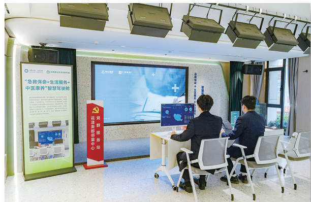
花漾美郡“智慧驾驶舱”实景。

以南阳明伦·花漾美郡项目为载体,建设我市首家智慧社区“紧急救护服务站”,再一次印证明伦集团的品牌实力。明伦厚植南阳,肩负期待,放眼未来,持续迭代创新健康产品和服务,以提升居住者的健康品质为价值,着力打造“全龄康养智慧社区”,不断优化地产服务新模式,这是我市“好房子”联盟以实际行动升级住房服务的探索之举。