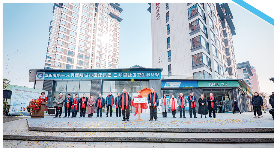
1月3日上午,三顾里社区卫生服务站揭牌。