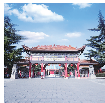
河南仰韶酒业集团大门。