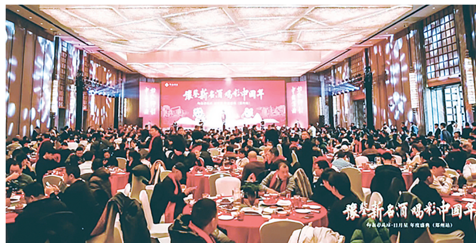
仰韶彩陶坊·日月星年度盛典(郑州站)活动现场。

一个月，三十余场，超两万人！日前，一股浓郁的“彩陶”风正在河南劲吹，由仰韶酒业举办的仰韶彩陶坊·日月星年度盛典自2024年12月23日在郑州开幕以来，陆续登陆河南其他地级市及其下辖的多个县区，为首个“世界非遗版”春节的到来增添了一抹亮丽的色彩。