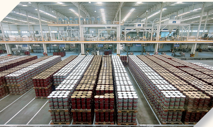
立邦新型环保建筑材料生产线。

在推进高质量发展实践过程中，南召县立足资源禀赋，紧扣“绿色循环”发展主线，不但当好工业龙头，夯实实体经济基石，也打响了农业品牌，融出了文旅活力，实现了产业与城市的深度融合。2024年，南召县GDP增长6.8%，高于全市1.3个百分点，充分彰显了其强劲的发展势头和广阔的发展前景。