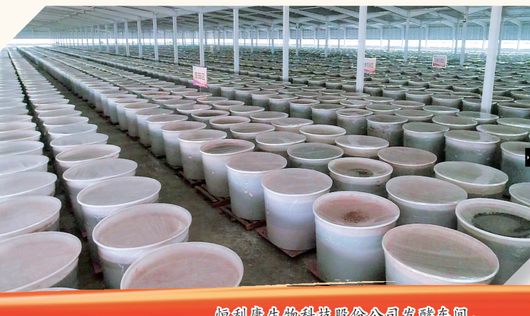
恒利康生物科技股份公司发酵车间。