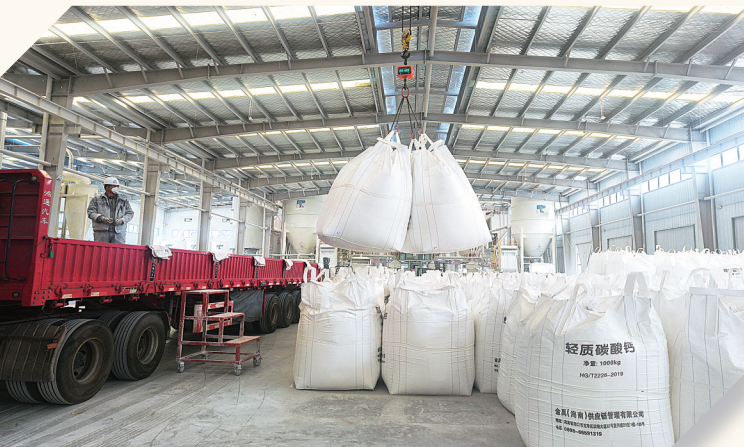
博泰新材料公司粉体成品车间。