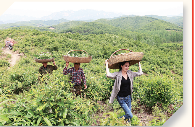
种茶鼓起了蚕农钱袋子。

南召县正以融合创新为笔，勾勒出一幅幅全域旅游的新画卷，让这片古老而又充满活力的土地焕发出更加璀璨的光芒。