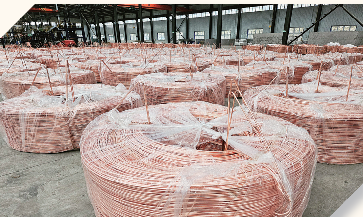
奇佳实业公司钢基新材料生产车间。