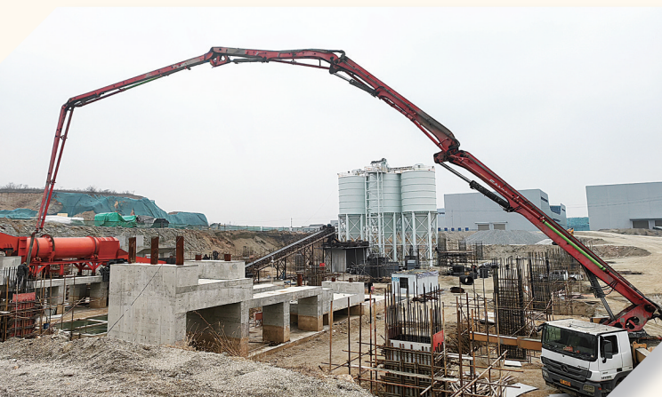
利迪产业园年产100万吨智能破碎分拣线施工现场。