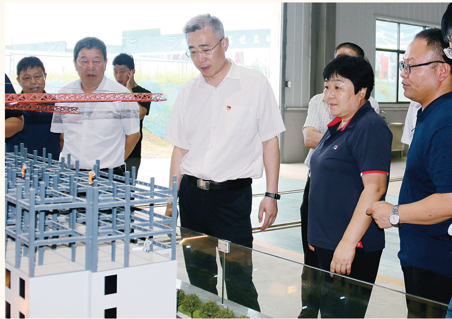
南召县委书记方明洋(中)入企走访问需。