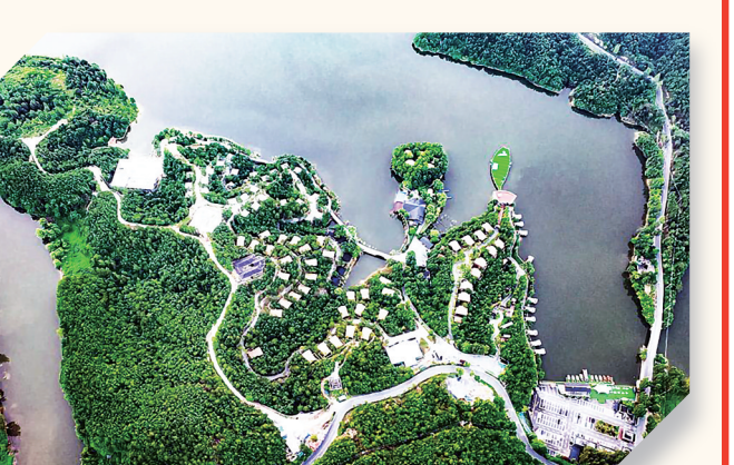
五朵山九龙湖紫花汀民宿集群。