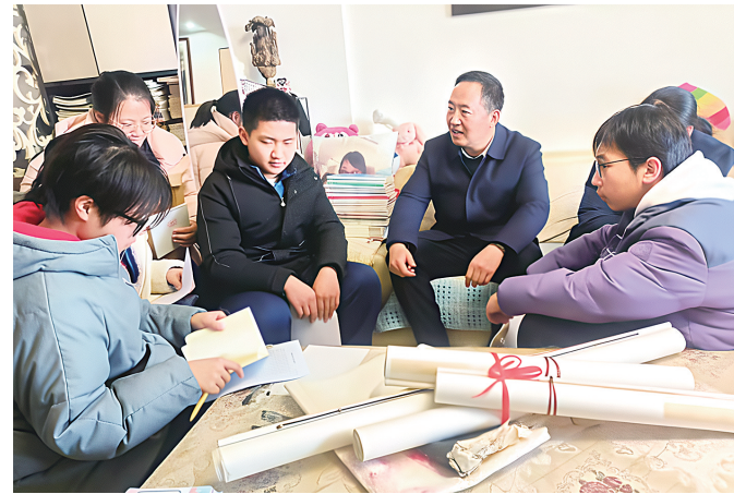
“阅读就是和伟大的灵魂对话,博览群书是做一切学问的基础。”近日,市一中组织30余名师生,来到“全国书香之家”...

打开书香河南公共文化平台首页,点击“2025年书香河南全民阅读系列赛事”专区,进入后用户选择所在地区的相应活动,进行报名。