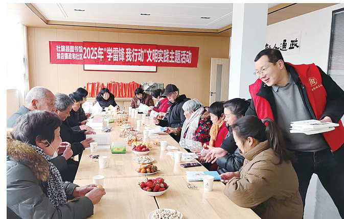
3月5日,第62个学雷锋纪念日,社旗县图书馆文化志愿服务队走进唐店镇和社区,开展“学雷锋 我行动”文明实践主题活动...