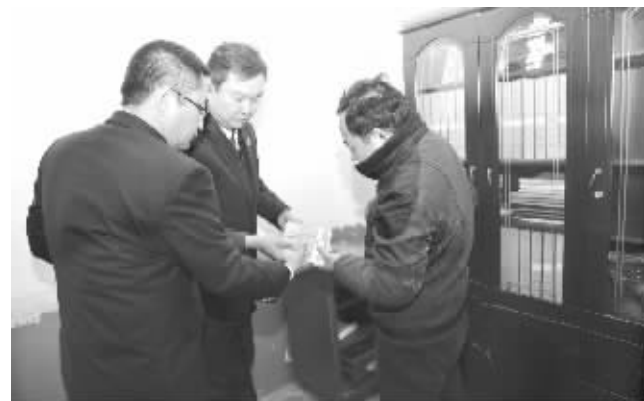
△2万元现金被搜了出来