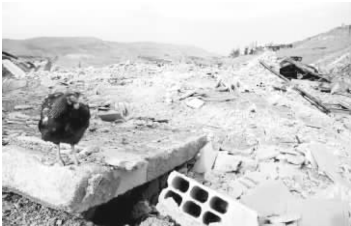
大马士革附近一处在以空袭中被摧毁的养鸡场

5日凌晨,叙利亚首都大马士革市郊一处今年1月遭以色列空袭的军事科学研究中心爆炸起火,叙利亚官方媒体指认以色列空袭,以方称无可奉告。这是以色列三天内第二次空袭叙利亚目标。西方国家情报官员说,两次空袭均针对叙利亚获自伊朗、准备转运给黎巴嫩真主党武装的导弹。