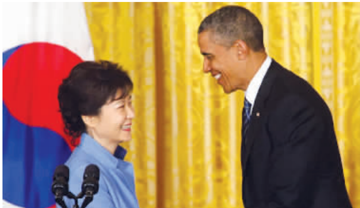
美国总统奥巴马(右)和韩国总统朴槿惠

美国总统奥巴马和韩国总统朴槿惠7日在会晤后表示,他们不会容忍来自朝鲜的威胁和挑衅,并呼吁朝鲜为恢复同国际社会接触以及获取援助采取有意义的步骤。