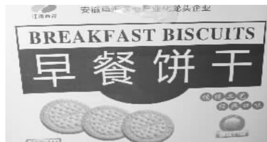
饼干包装箱