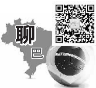
嘉士多网批商贸城

昨日凌晨的三场比赛当中,六支球队一共贡献了11粒入球,由此可见比赛的激烈程度,而智利爆冷击败西班牙又令多少球迷始料不及呢?对于这样的比赛,球迷们有话要说。