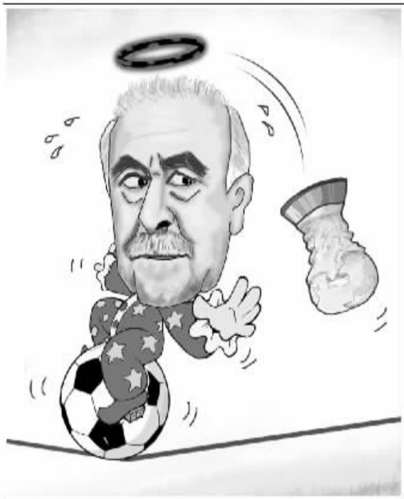
“魔咒”再现 新华社发 赵乃育 作

回想4年前的南非世界杯,意大利在小组赛踢得也是十分狼狈,最终倒在了“打平就能出线的魔咒”,3战2平1负,仅仅积分2分小组倒数第一耻辱出局。再回顾下2002