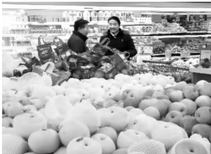
近期水果销量大增

马上就是2015年元旦,在节日因素和季节因素的双重作用下,市场上不少农贸产品的价格出现快速上涨的现象,让不少市民感叹蔬菜市场进入了“节日状态”。而回顾2014年,不少农贸产品在市民心中留下了深刻的印象,1月份30元一公斤的长豆角、大半年比肉贵的“姜你军”、8月份里12元一公斤的“火箭蛋”……这些都让人难以忘却。