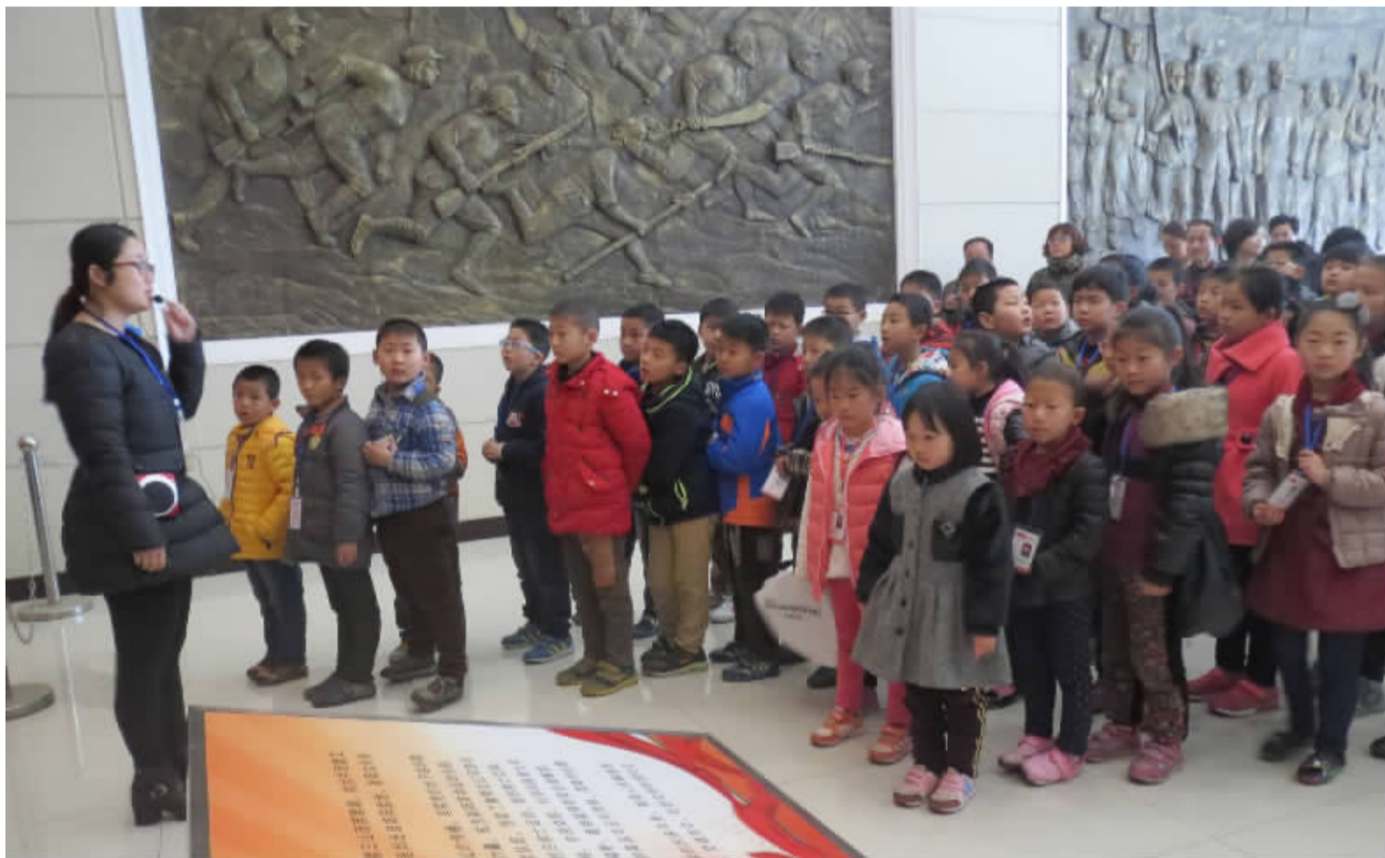
清明节期间,南阳晚报小记者中心组织小记者到南阳烈士陵园扫墓,100 多名小记者和家参加。小记者们瞻仰烈士纪念碑,排队走过烈士墓地,参观了南阳革命纪念馆,受到了一次心灵上的洗礼和教育。图为小记者们在聆听南阳革命历史讲解。