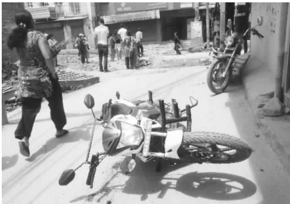
5月12日,在尼泊尔加德满都,一辆摩托车在地震中摔倒在地。

中国驻尼泊尔大使馆政务参赞程霁12日表示,目前暂未收到有关此次地震中方在尼人员伤亡的报告。