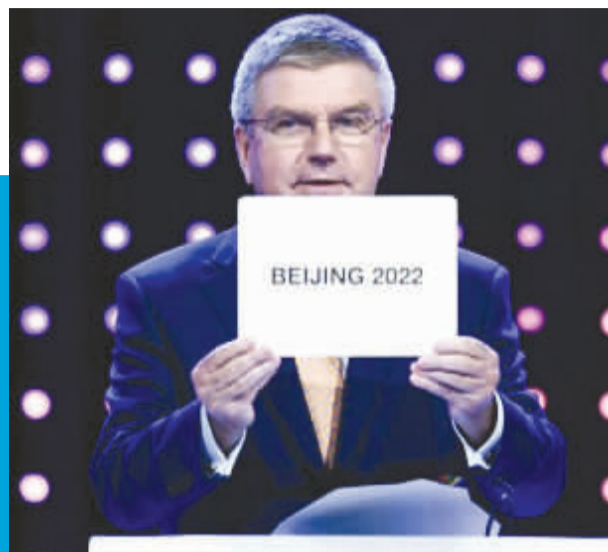
国际奥委会主席巴赫宣布举办城市

7月31日,北京令世界再次心动,中国将续写奥运辉煌。7月31日下午,国际奥委会第128次全会在马来西亚吉隆坡投票决定,将2022年冬奥会举办权交给北京。中共中央总书记、国家主席、中央军委主席习近平致信申办冬奥会代表团表示热烈祝贺。