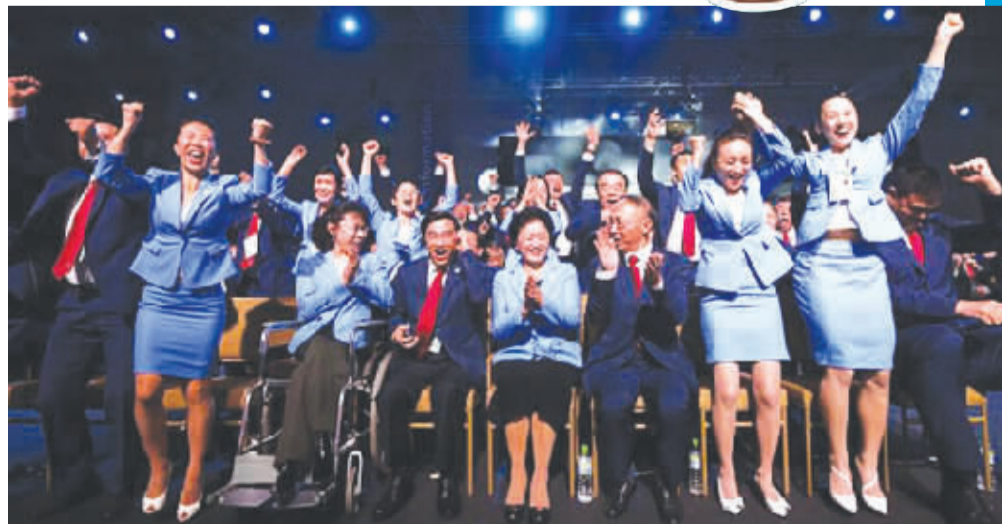
中国申冬奥代表团庆祝获胜