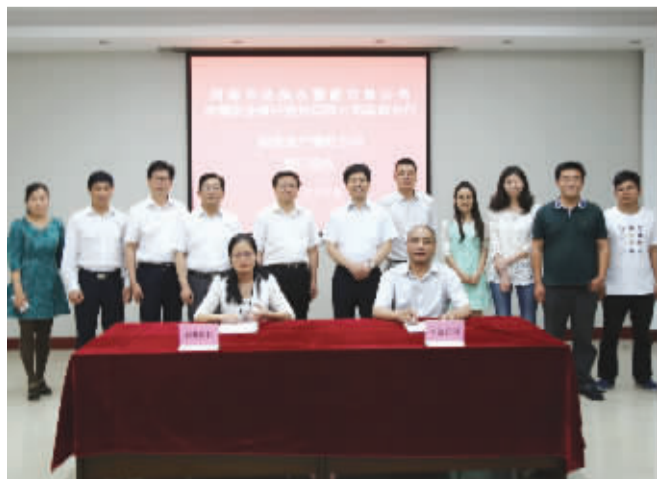
农行南阳分行与河南天池抽水蓄能有限公司隆重举行20亿元固定资产借款项目合作签约仪式。

对企业来说,政府产业基金可通过股权融资,更有效地解决资金,增强抗风险能力,同时依靠良性持续融资渠道,减轻企业过高债务负担的束缚,从一定程度上可以解决融资难问题,添补中小企业融资链条缺失,支持企业持续创新与持续成长。①5