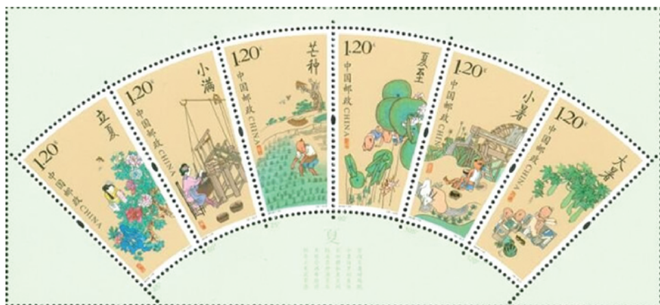
《二十四节气(二)》特种邮票

中国邮政5月5日发行《二十四节气(二)》特种邮票1套6枚,图案内容分别为立夏、小满、芒种、夏至、小暑、大暑,全套邮票面值为7.20元。