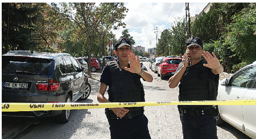
警察在以色列驻土耳其大使馆门前警戒

据新华社安卡拉9月21日电 以色列驻土耳其大使馆门前21日发生枪击事件,两名持刀者试图闯进使馆受阻,其中一人被使馆警卫开枪打伤。