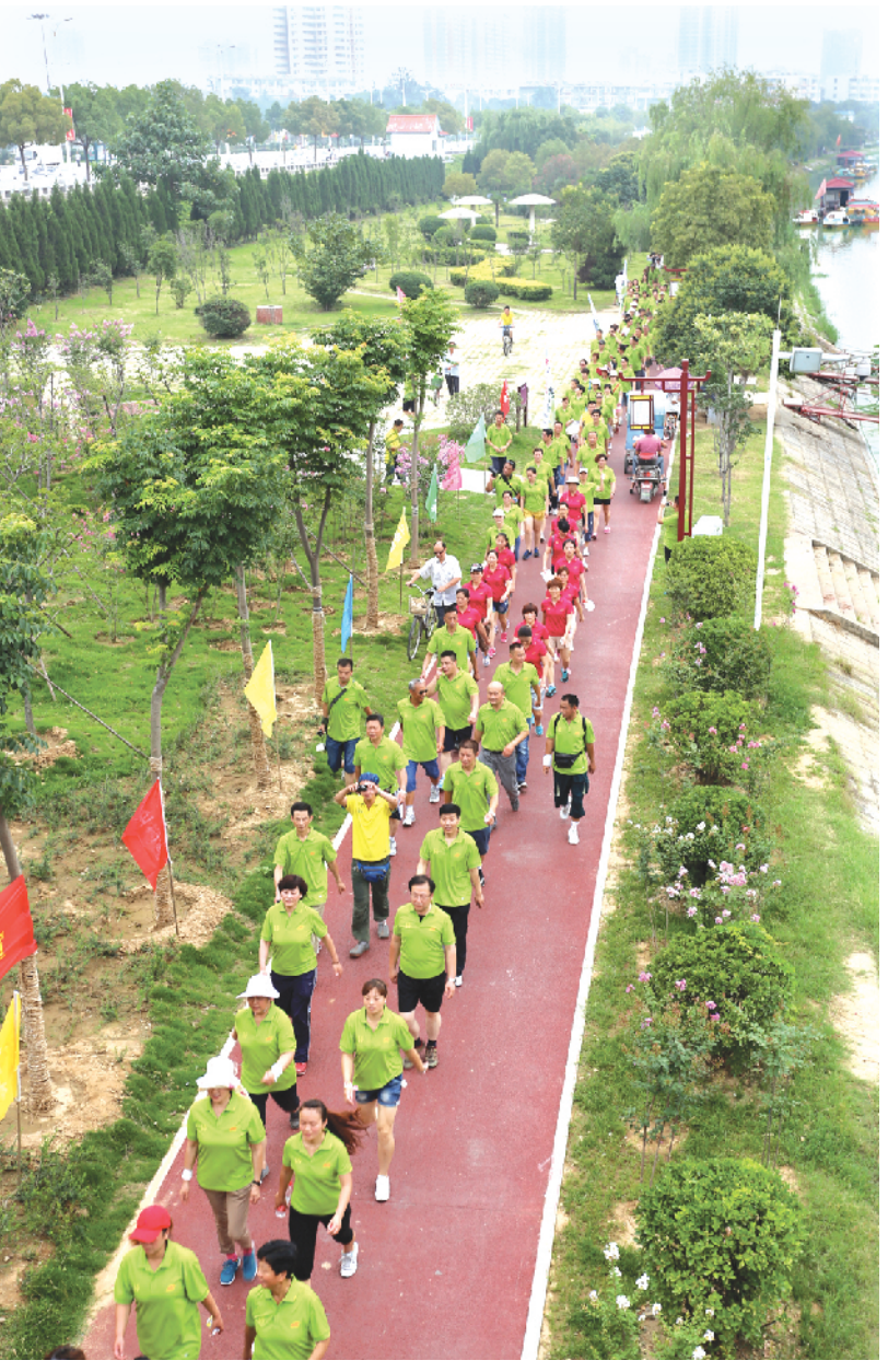
市民组队在白河滨水绿道健身

点评：这是南阳政治民主生活中的一件大事，也是事关全市改革发展大局、民主法治进程的一件大事。这必将进一步提高政府依法行政水平，有效维护人民群众的根本利益。