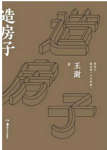
《造房子》王澍 著 湖南美术出版社