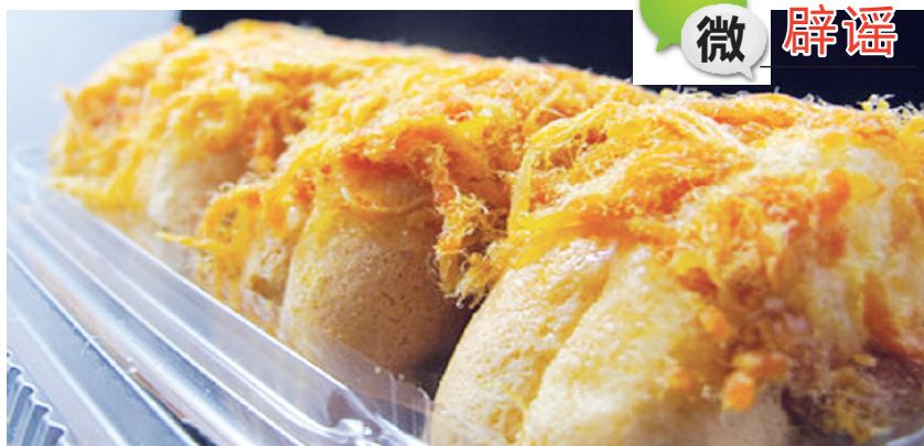
肉松面包

肉松是指用肉作为主要原料,经多道工序后制成的肌纤维蓬松絮状的肉制品;棉花是锦葵科棉花属植物的种子纤维。肉松和棉花有很大区别。肉松的本质是一种