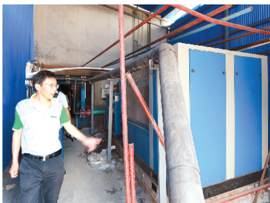
新建的环保设施超频空气压缩机