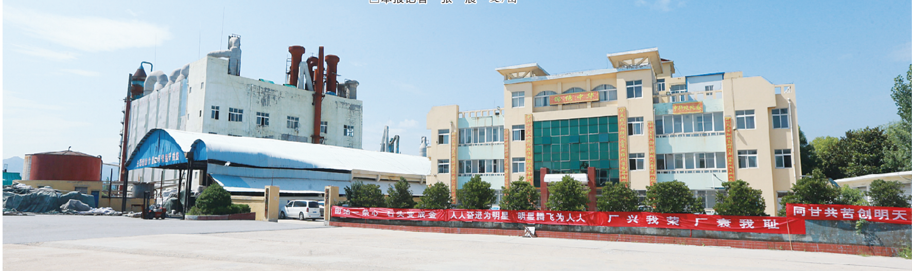
蓝天下的桐柏明星化工