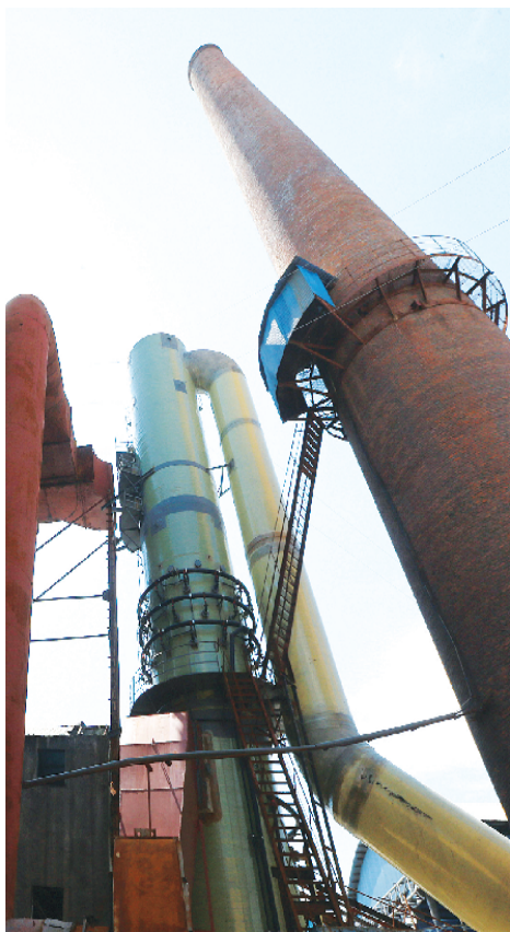
新建的脱硫脱硝塔

环境保护是国家的基本国策,环境是人类赖以生存的根本。桐柏明星化工有限公司一直把保护生态环境放在首位,立志要做一个有社会责任感的企業。为此,该公司积极探索节能、减排、降污方式,并投入大量资金用于升级改造超低排放设备。今年7月份,该公司超低排放改造工程顺利完工。